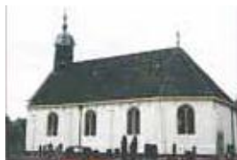
Nij Brongergea Tsjerke - De Knipe

Zondag 13 september - Nij Brongergea Tsjerke - 9.30 uur Online dienst met beeld en geluid via Kerkdienstgemist.nl Zondag 27 september - Stoer-veld - 10.00 uur Startzondag