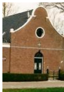
Doopsgezinde kerk - De Knipe