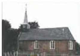
Aengwilder Tsjerke - Tjalleberd